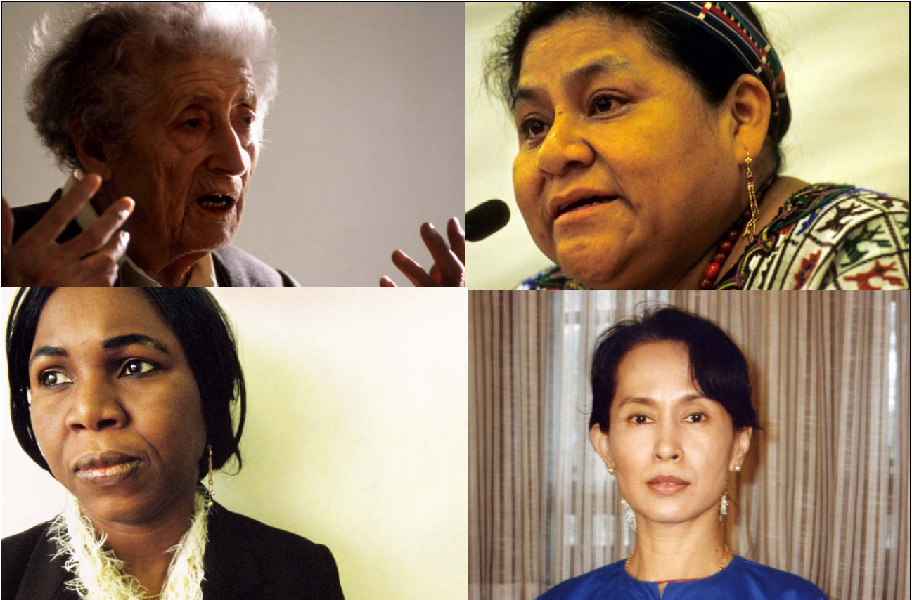
Lucie Aubrac (France), Rigoberta Menchu Tum (Guatemala), Hauwa Ibrahim (Nigeria), Aung San Suu Kyi (Birmanie )

Pour la 2 e année, la Ville d'Évreux célébrera les droits des femmes, à l'occasion de la Journée Internationale des Droits de la Femme, le 8 mars.