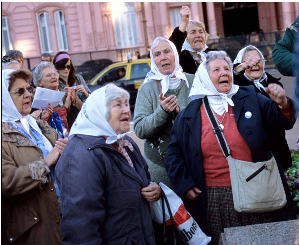
Les dames en blanc de Cuba